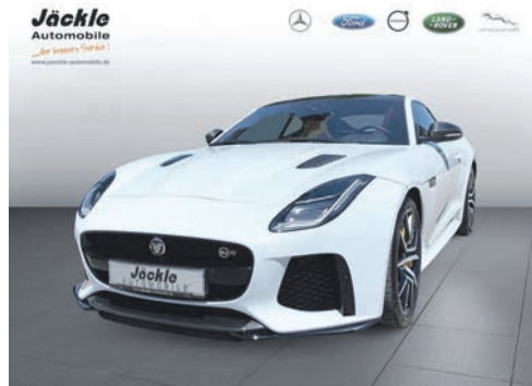
Jaguar F-Type SVR Vollausstattung 06.2018 EZL | 21.000 km | 443 kw 575 PS | 89.900 €