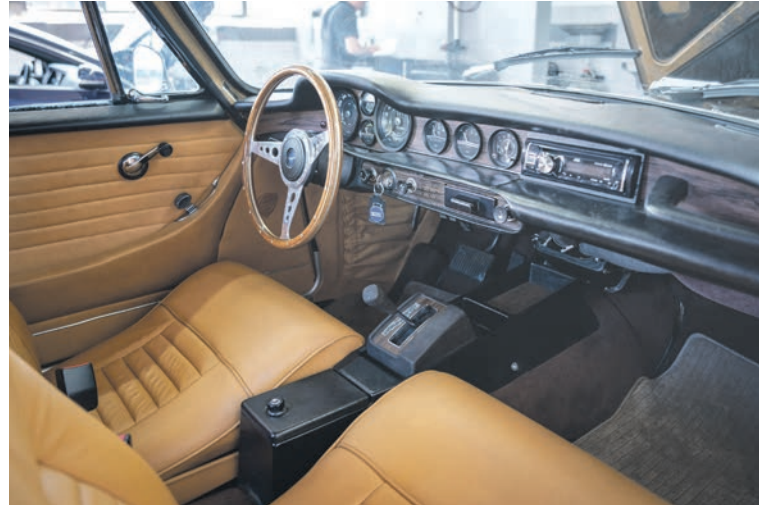
Bei Classic Cars Jäckle teilen Besitzer von Oldtimern ihre automobile Leidenschaft mit dem Team von Jäckle Automobile und anderen Gleichgesinnten.