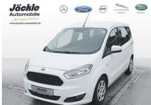
Ford Transit Courier Kastenwagen Basis 1,0 ltr 74 kw/100 PS Benziner

Leasing 48 Monate: 15.000 km p.a. Leasingsonderzahlung: 1.500,00 € Monatliche Rate: 187,00 €