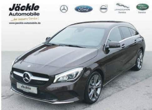
CLA 180 Shooting Brake 02.2018 EZL | 63.500 km | 90 kW 122 PS | Benzin | 22.595 €