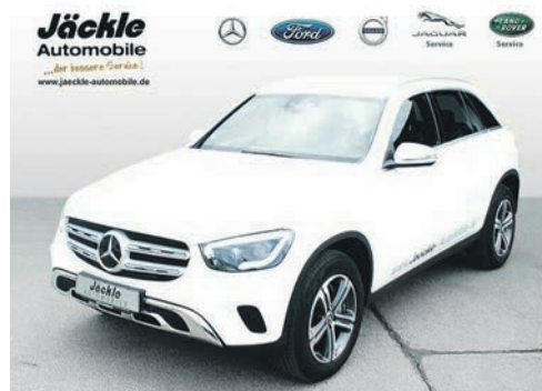
GLC - Klasse GLC 300 4Matic 10.2019 EZL | 29.000 km | 140 kW 190 PS | Benzin | 48.550 €