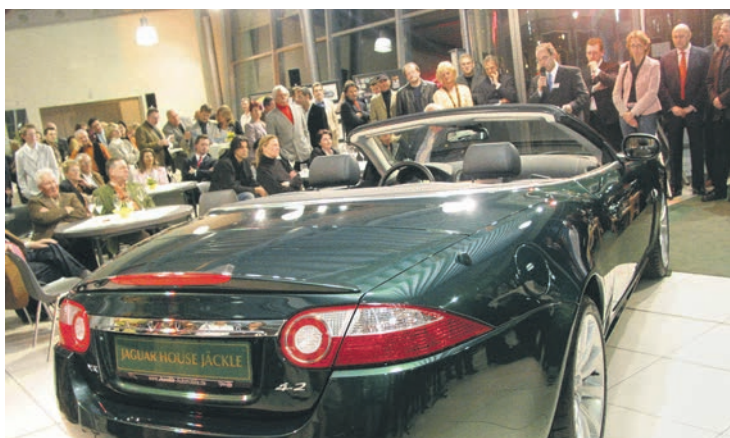
Regelmäßig finden bei Jäckle Automobile Jaguar-Neuwagenvorstellungen statt.