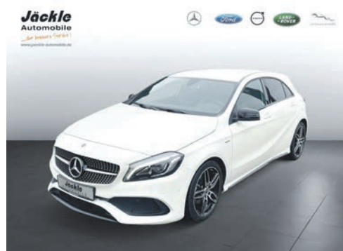
A - Klasse A 200 AMG 03.2018 EZL | 50.000 km | 115 kW 156 PS | Benzin | 25.295 €

bietet das renommierte Autohaus Jahres- und Vorführwagen sowie Junge Gebrauchte an und vermittelt alle Mercedes -Pkw, -Van, -SUV und -Transporter. Auch von Mercedes wurde Jäckle Automobile in Mindelheim für hervorragende Service-Leistungen ausgezeichnet.