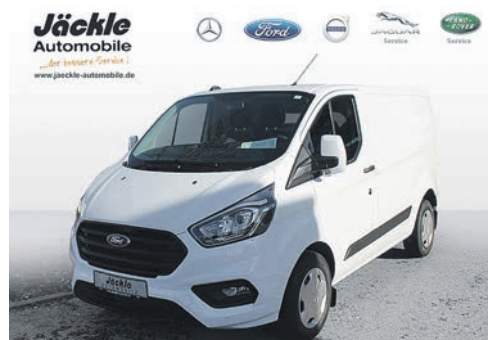
Ford Transit Custom Kastenwagen Basis 280 L1 2,0 ltr. 77kw/105 PS Diesel

Leasing 48 Monate: 15.000 km p.a. Mietsonderzahlung: 0,0 € Monatliche Rate: 169,00 €