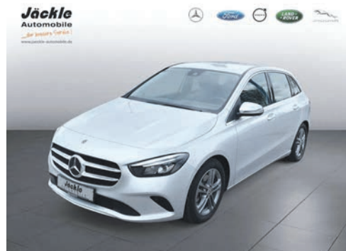
B - Klasse B 220 4Matic 03.2019 EZL | 17.000 km | 140 kW 190 PS | Benzin | 32.490 €