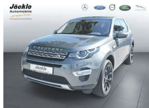
Land Rover Discovery Sport 03.2018 EZL | 81.250 km | 132 kw 180 PS | Diesel | 32.950 €