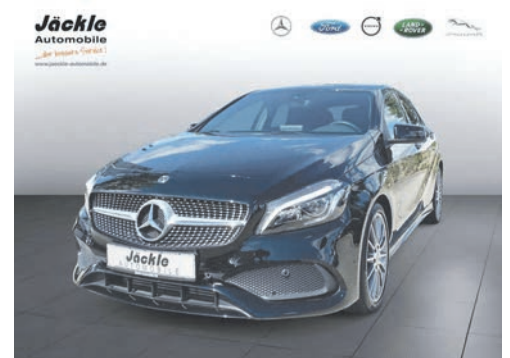
A - Klasse A 220 4Matic 06.2017 EZL | 31.000 km | 135 kW 184 PS | Benzin | 26.950 €