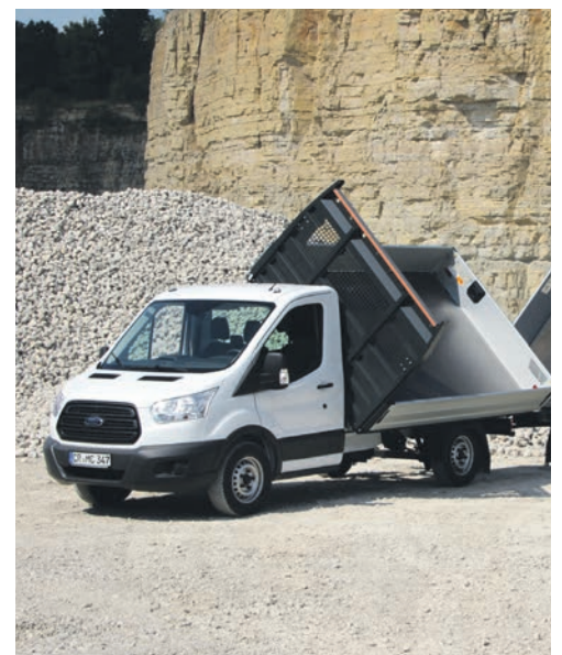
Ford Transit Kipper, auch Koffer- und Kühlaufbauten, Regaleinrichtungen werden angeboten.

Erwin und Anton Baur, Elektro Baur, Mörgen