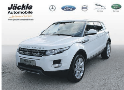
Range Rover Evoque 11.2014 EZL | 92.047 km | 140 kw 190 PS | Diesel | 23.500 €

ner und haben in unseren Autohäusern Dienst-, Gebraucht- und Jahreswagen. Darüber hinaus vermitteln wir auch Neuwagen.“ Wie wäre es beispielsweise mit einem neuen Discovery, einem Discovery Sport, einem Defender oder einem Range Rover, Range Rover Sport oder Range Rover Evoque? Übrigens: Alle Reparaturen werden bei Jäckle Automobile mit von LandRover geschulten Kfz-Meistern zuverlässig durchgeführt.