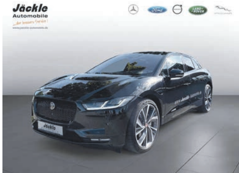
I-Pace 12.2020 EZL | 17.250 km | 236 kw 320 PS | Elektro | 69.950 €