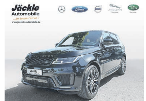
Range Rover Sport 04.2018 EZL | 88.750 km | 190 kw 258 PS | Diesel | 57.500 €