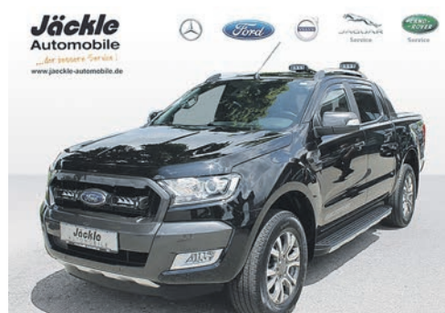
Ford Ranger Einzelkabine 2.0 ltr 96kw/130PS Diesel Allrad

Leasing 48 Monate: 15.000 km p.a. Mietsonderzahlung: 0,0 € Monatliche Rate: 289,00 €