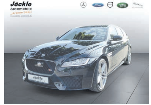
XF Sportbrake 08.2018 EZL | 84.590 km | 221 kw 300 PS | Diesel | 31.950 €