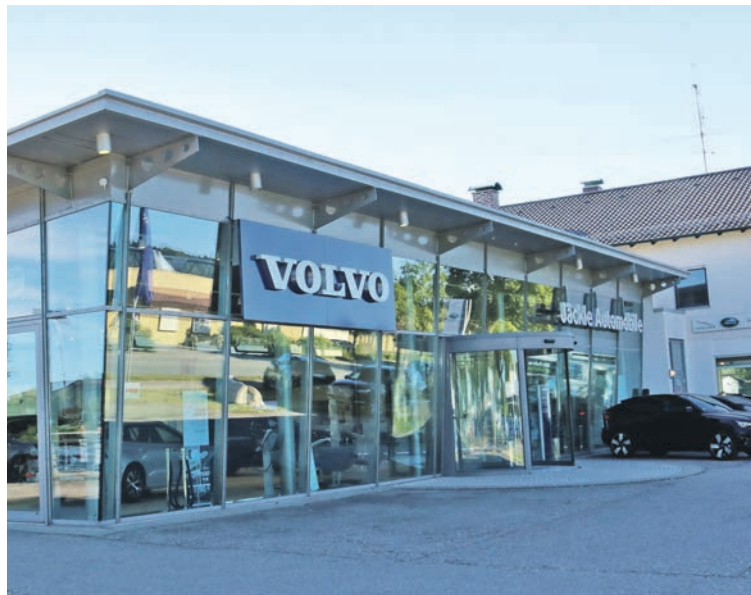
Jäckle Automobile an den Standorten in Mindelheim (links) und Bad Wörishofen (rechts).

50 Jahre, ein halbes Jahrhundert ist unser Autohaus mit besonderen Werten verbunden. Tradition, Moderne, Perfektion in allen Abteilungen und gelebte Freude am Automobil, an der Mobilität und der Betreuung nach dem Kauf im Service, sind die Begeisterung die wir, die Unternehmerfamilie Jäckle und unsere Mitarbeiter jeden Tag in unserem Geschäft unsere Kunden spüren und erleben lassen. Mit unseren Produkten, Marken und Leistungen begeistert wird jeden Tag auf neue unsere Kunden und Interessenten. Ständig neue Modelle aller Marken und zusätzliche Hersteller, die wir im Laufe der Jahrzehnte in unser Programm aufgenommen haben, machen unser Autohaus in der Region einmalig. Jeder Kunde und Interessent findet bei uns das richtige Mobil, egal welcher Antriebsart,