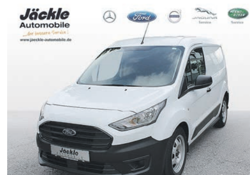
Ford Transit Connect Kastenwagen Basis L 1,0 ltr. 72kw/100 PS Benziner

Leasing 48 Monate: 15.000 km p.a. Mietsonderzahlung: 0,0 € Monatliche Rate: 289,00 €