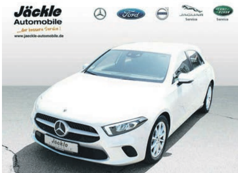
A - Klasse A 220 Progressive 07.2020 EZL | 17.500 km | 140 kW 190 PS | Benzin | 33.650 €