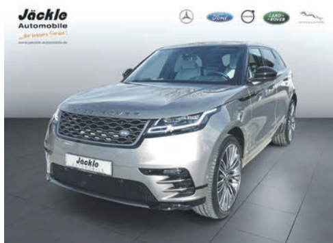
Velar R-Dynamic 04.2018 EZL | 76.750 km | 280 kw 380 PS | Diesel | 61.995 €