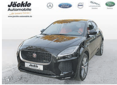
E-Pace R-Dynamic 10.2018 EZL | 31.685 km | 183 kw 249 PS | Benzin | 37.880 €