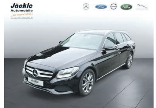
C - Klasse T-Modell C 180 06.2017 EZL | 66.500 km | 115 kW 156 PS | Benzin | 25.295 €