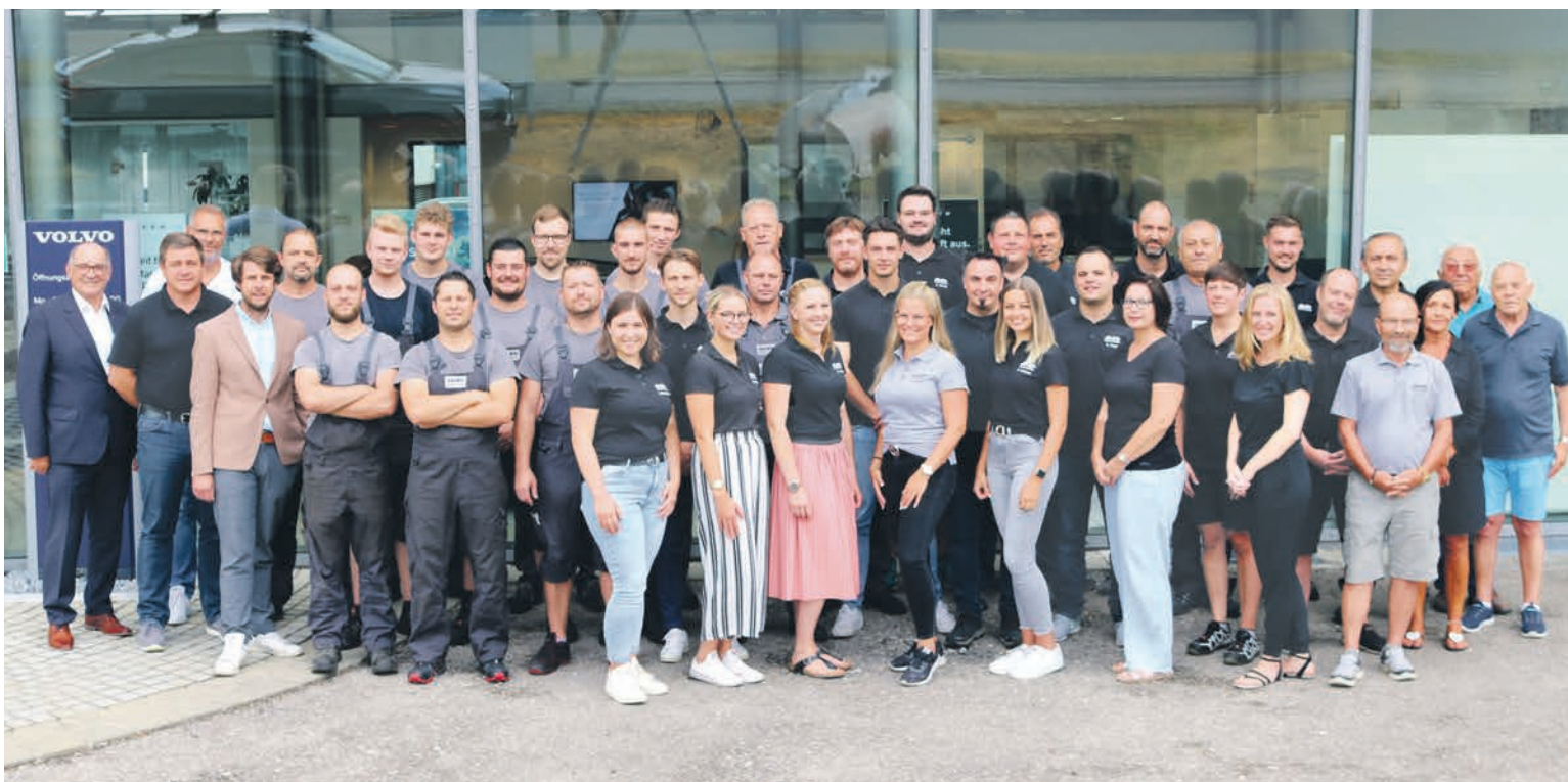
Das Team von Jäckle Automobile – dynamisch, erfahren, kompetent!