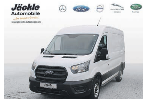
Ford Transit Kastenwagen Basis 290 L2/H2 2.0ltr. 77 kw/105 PS Diesel

Leasing 48 Monate: 15.000 km p.a. Leasingsonderzahlung: 3.500,00 € Monatliche Rate: 299,00 €