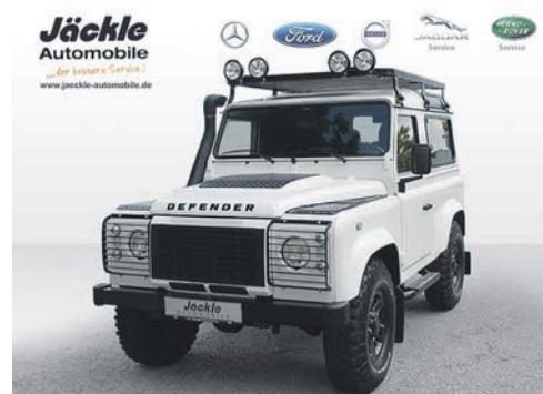
Defender 90SE 04.2008 EZL | 104.590 km | 90 kw 122 PS | Diesel | 45.900 €