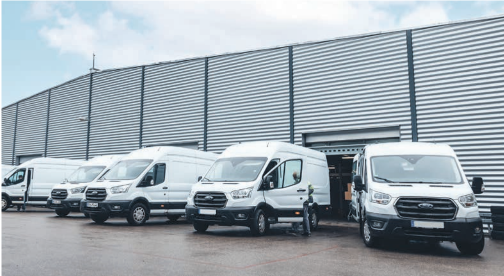
PCS-Fordteile- Logistikcenter in Greding/Altmühltal.