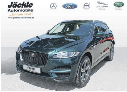
F-Pace 20d Portfolio 12.2017 EZL | 53.300 km | 132 kw 180 PS | Diesel | 39.850 €